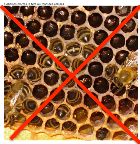
Abeilles mortes la tête au fond des cellules à la recherche de la dernière goutte de miel

A donner aux environs de Noël, et enlevé aux premières floraisons.